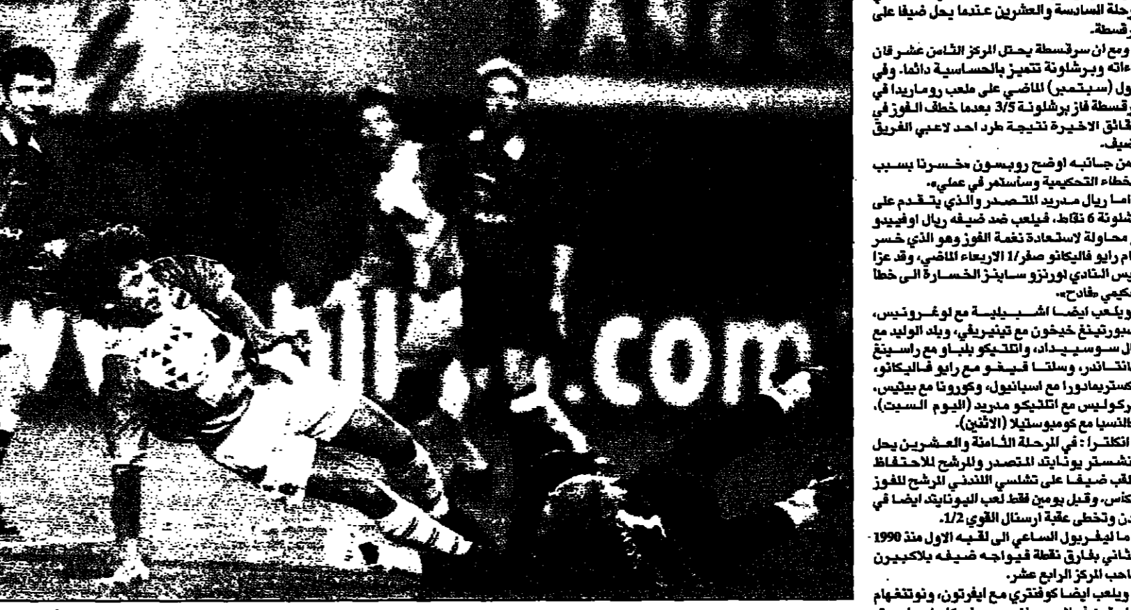
لقطة من إحدى مباريات مانشستر يونايتد (صورة من الأرشيف)